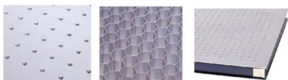
精密鑽孔攻牙 蜂巢式結構 外型雷射切割